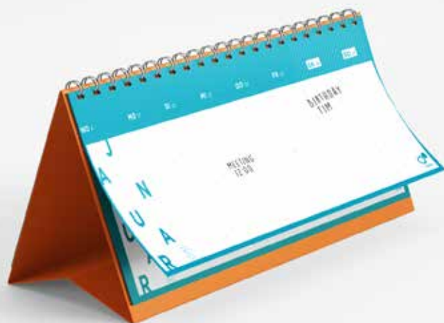
CALENDARIO DA TAVOLO SUPERYUPO FRBG 110